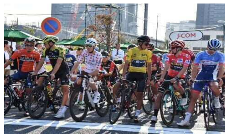
【ツール・ド・フランスさいたまクリテリウム】

さらに、法人化した「(一社)さいたまスポーツコミッション」の活動を支援する必要があります。