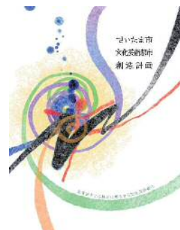
【文化芸術都市創造計画】

さらに、文化会館機能、コミュニティ機能を備えた新市民会館おおみやの整備を進める必要があります。