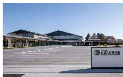
【岩槻人形博物館 外観】

本市の特色ある地域資源である人形を活用し、人形文化の振興を図るとともに、観光振興等にも寄与するため、人形文化の拠点施設である岩槻人形博物館について、管理運営の安定・充実を図る必要があります。