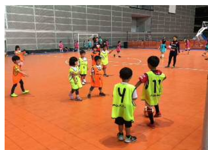
【さいたまスポーツフェスティバル2019】