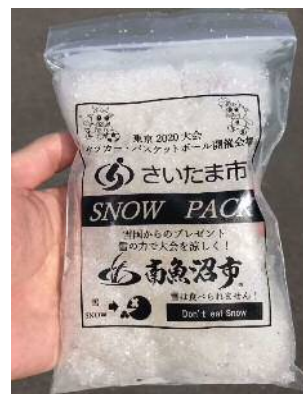
【令和元年度に実施した暑さ対策の実証実験の中で配布したスノーパック】

また、観戦客等が、大宮の盆栽をはじめとした本市の魅力に触れる機会を増やし、市の知名度向上やイメージアップを図る必要があります。このために、観戦客等を対象に、事前にプロモーションを行うとともに、大会期間中にイベント開催や市内の観光資源を巡る回遊バスの運行等のおもてなしを実施する必要があります。